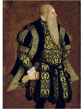
Gustaf I Eriksson.

JOHAN III: Son till Gustaf I Eriksson, tabell 1. * 1537 20/12, † 1592 17/11. Svensk kung 1569-1592. o-o Katarina Hansdotter, Stjärnsparre . Barn: