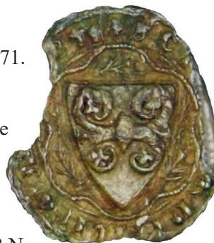
Kristien av Ölands sigill.

KRISTIERN NILSSON: * ca 1360, † 1442 29/4. Riddare 1396, riksråd 1413, riksdrots 1435. Häradshövding i Seminghundra 1401-1435. oo 1 Margareta Johansdotter Molteke , oo 2 Margareta Eriksdotter Krummedike . Barn 2: